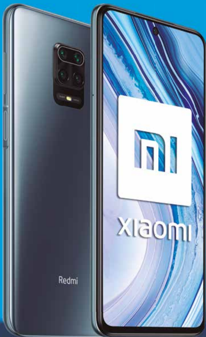
mi xiaomi Redmi Note 9 Pro

Estrena un Xiaomi al mejor precio y sin permanencia