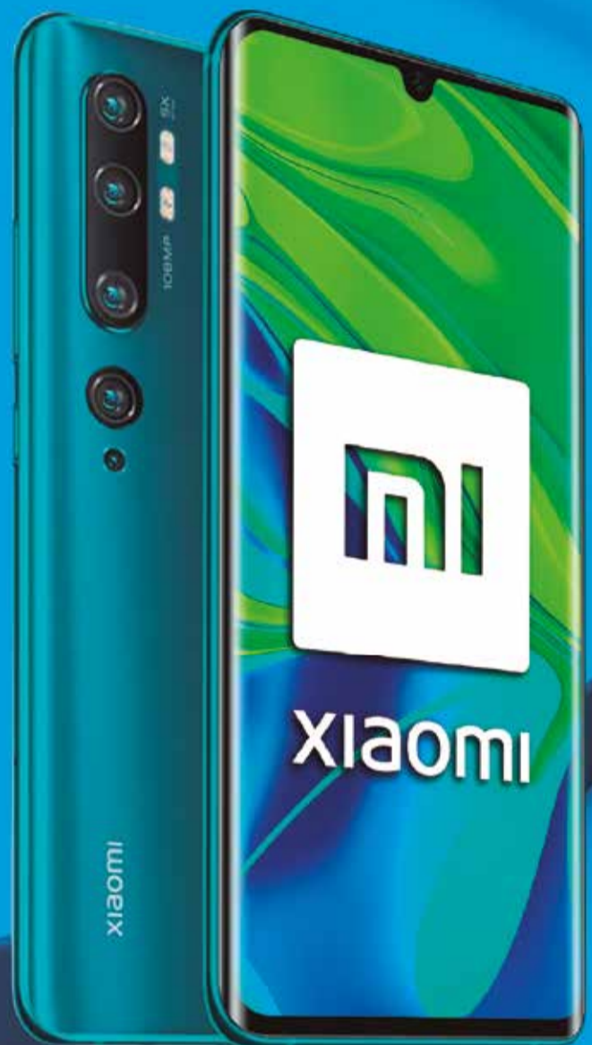
mi xiaomi Mi Note 10