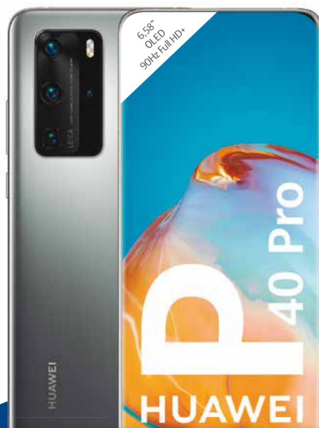
HUAWEI P40 Pro CO-ENGINEERED WITH

Mejor Precio Garantizado 869€ | 29,24 €/mes 36 meses