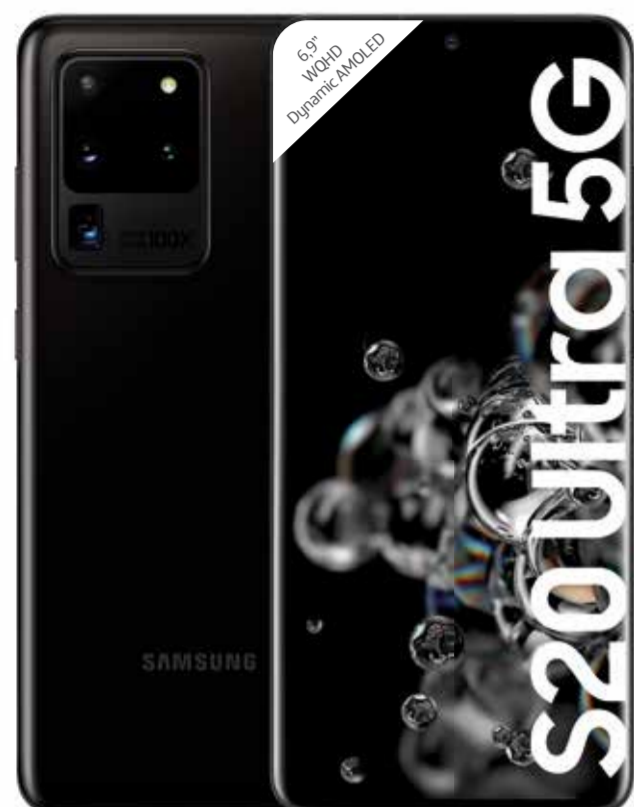
SAMSUNG Galaxy S20 Ultra 5G