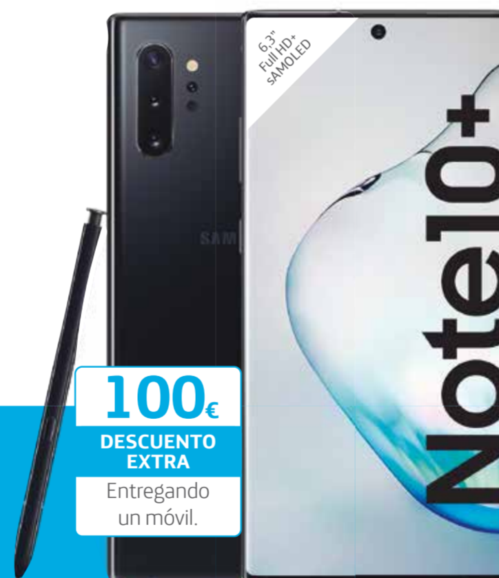
SAMSUNG Galaxy Note10+ 256 GB

100€ DESCUENTO EXTRA Entregando un móvil.